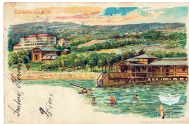
Historische Postkarte von Crikvenica, damals noch »Cirkvenica« (abgeleitet von crikva=Kirche) mit dem Hotel Therapia im Hintergrund und einer Badeanstalt.