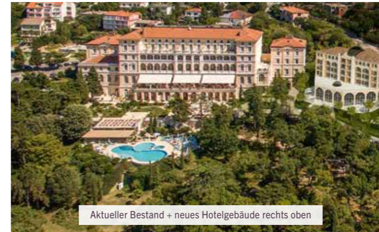
Aktueller Bestand + neues Hotelgebäude rechts oben