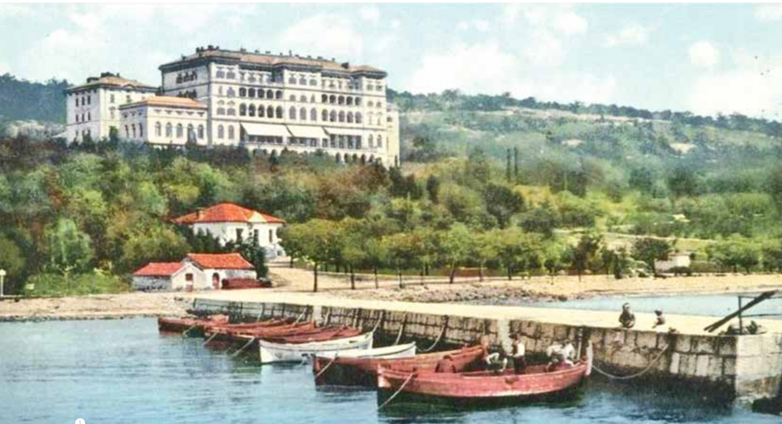
Hotel Erzherzog-Josef (seit 1998 Therapia, heute Kvarner Palace) mit der Bootsanlegestelle Crni Molo auf einer Ansichtskarte aus dem Jahr 1898.

Nur wenige bauhistorisch bedeutende Palasthotels aus dem späten 19. Jahrhundert haben beide Weltkriege überstanden. Sie zählen heute zu den Architektur-Ikonen der Welt.