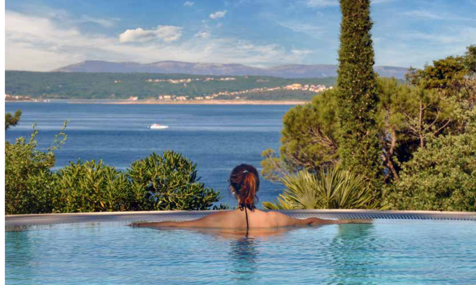
Das sind ja schöne Aussichten! – Blick vom Kvarner-Palace-Pool über die Adria bis zur Insel Krk.