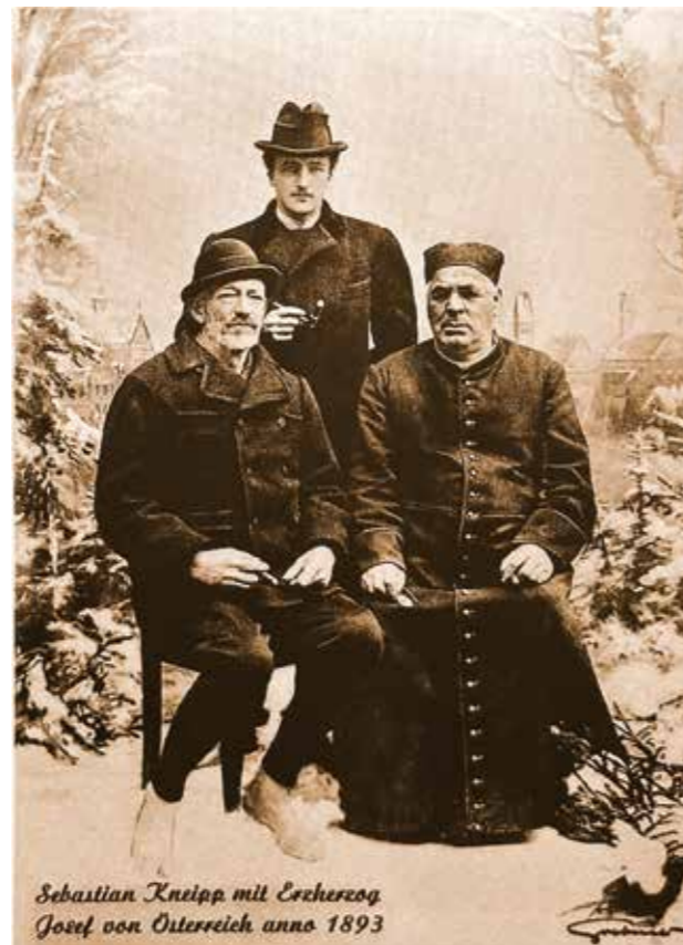
Sebastian Kneipp mit Erzherzog Josef von Österreich anno 1893

1893 holten Erzherzog Josef (links) und sein Sohn August (Mitte) den Hydrotherapeuten und Naturheilkundler Sebastian Kneipp (rechts) als Therapieberater vom verschneiten Deutschland nach Crikvenica. Immer mehr Ärzte sandten ihre Patienten damals in den ungarischen Küstenort – zum Seebaden im Sommer und zum Überwintern im Heilklima.