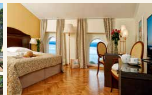
Schöne Aussichten. Doppelzimmer mit Meerblick, Aussicht vom Balkon (oben). Terrasse der Erzherzog-Josef-Suite (unten links). Mansardenzimmer mit Meerblick.