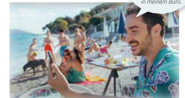
Screenshot Youtube »Make Your Own Movie«

Of course! I am in my office. Natürlich. Ich bin (hier) in meinem Büro.